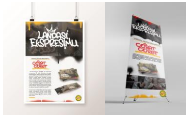
Gambar 5 Media Pendukung “ Poster & X-banner “