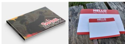
Gambar 6 Media Pendukung “ Sketchbook & Stiker “