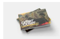
Gambar 4 Media Utama “ Visual Book

Media utama yang dipilih adalah visual book , media utama ini dipilih karena dapat membantu penulis mempresentasikan konten mengenai dasar-dasar graffiti dengan lengkap dan mudah dipahami karena di dalam buku ini dominan dalam isinya berkonten visual untuk menyampaikan informasinya visual book ini juga dapat mempresentasikan tentang ekspresi kreatifitas yang memang di lakukan oleh para remaja tersebut yaitu mencorat-coret dan di media utama ini terdapat pengalihan media yang dapat membantu para remaja mempelajarinya terlebih dahulu sebelum terjun di ruang publik