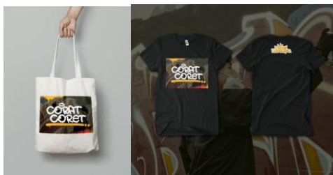
Gambar 6 Media Pendukung “ Totebag & T-shirt “