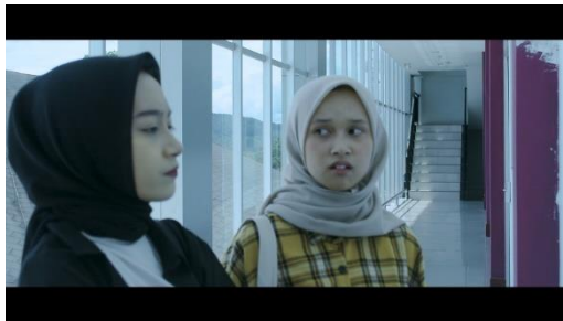
Gambar 3. Adegan 3

muda krem yang dia kenakan di pundaknya. Dari segi pencahayaan, lebih banyak cahaya alami karena menggunakan cahaya alami dari sinar matahari tanpa bantuan pencahayaan tambahan. Cahaya alami memainkan peran penting dalam film dengan menciptakan keadaan realistis dan alami, meningkatkan emosi karakter, dan membentuk hubungan. Ini sering digunakan selama jam-jam ajaib untuk menghasilkan atmosfer yang hangat dan ambigu, yang secara signifikan berdampak pada penceritaan visual (Zhao, 2023). Kemudian untuk memotret dalam adegan ini menggunakan sudut setinggi mata Statis dengan bidikan tipe Medium-Shot.