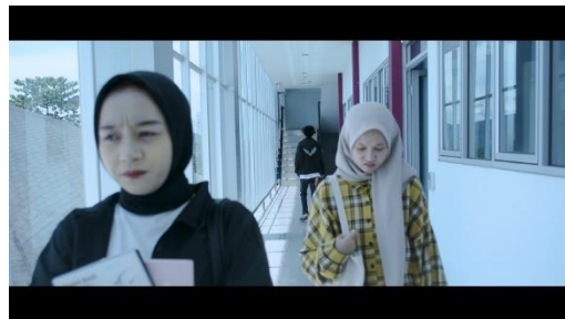
Gambar 2. Adegan 2

siswa. Selanjutnya, untuk pemotretan, menggunakan sudut setinggi mata dengan bidikan tipe Medium-Shot. Bidikan sedang membingkai tubuh manusia dari pinggang ke atas. Komposisi bidikan medium juga dapat menyampaikan hubungan spasial, meningkatkan penceritaan dengan menghubungkan karakter secara visual dan lingkungannya (Markham, 2023). Untuk pencahayaan itu sendiri lebih merupakan cahaya alami karena menggunakan cahaya alami dari sinar matahari tanpa bantuan pencahayaan tambahan.