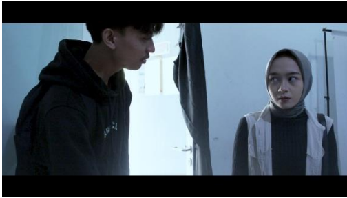
Gambar 5. Adegan 5

menciptakan rasa kerentanan atau inferioritas pada subjek, mempengaruhi persepsi pemirsa, yang selaras dengan fokus penelitian pada sudut kamera dan efeknya (Savardi et al., 2023). Jenis bidikan yang digunakan adalah Medium-Close-Up dan pencahayaan cahaya alami karena menggunakan cahaya alami dari ruang studio tanpa bantuan pencahayaan tambahan.