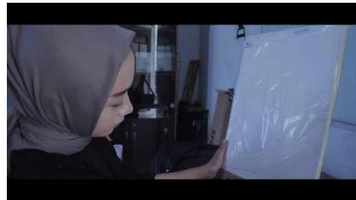
Gambar 4. Adegan 4

tambahan. Kemudian untuk memotret dalam adegan ini menggunakan sudut pandang setinggi mata Ikuti dengan bidikan tipe Medium Close Up. Medium Close Up menunjukkan tubuh manusia dari pinggang ke atas. Gerakan dan ekspresi wajah terlihat lebih jelas dan karakter dominan mulai terlihat dalam bingkai. Medium close-up berfungsi untuk meningkatkan keintiman emosional dan verbal dengan mensimulasikan invasi ruang pribadi dunia nyata, memungkinkan penonton untuk mengalami kedekatan dengan karakter, sehingga mengintensifkan narasi dan keterlibatan emosional dalam konteks sinematik (Persson, 1998).