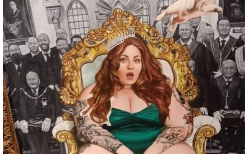
Sumber: Pribadi (2025)

Sedangkan warna monokrom terhadap para pria diindikasikan bahwa ada kesan masa lampau yang telah berlalu, bisa dapat diartikan bahwa para pria merupakan masa lalu dari model utama wanita tersebut.