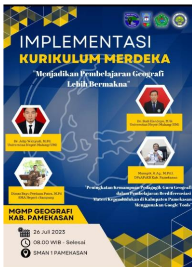
Gambar 2. Pengumuman kegiatan pelatihan peningkatan kemampuan guru geografi materi kependudukan melalui pembelajaran berdiferensiasi.