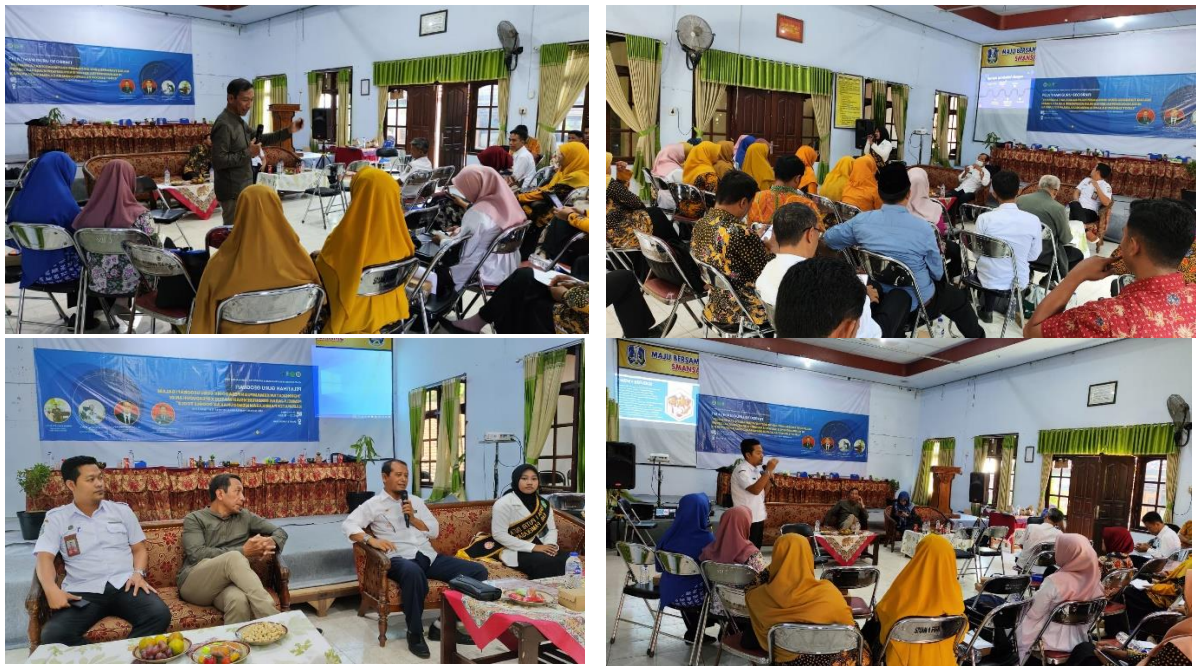
Gambar 3. Peserta mendengarkan pemateri terkait penguatan pemahaman pembelajaran berdiferensiasi

Hasil kegiatan pelatihan kemampuan pedagogik guru Geografi pada Materi Kependudukan melalui pembelajaran berdiferensiasi ini terdapat poin-poin yang dapat dijelaskan sebagai berikut.