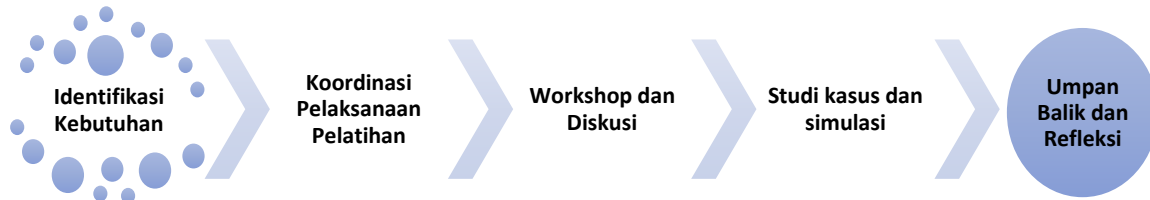
Gambar 1. Metodologi Pelaksanaan Pengabdian

Sesi umpan balik dan refleksi dilakukan untuk mendiskusikan pengalaman para guru, tantangan yang dihadapi, dan solusi yang berhasil diterapkan. Hal ini mendorong pembelajaran kolaboratif dan pertukaran ide.