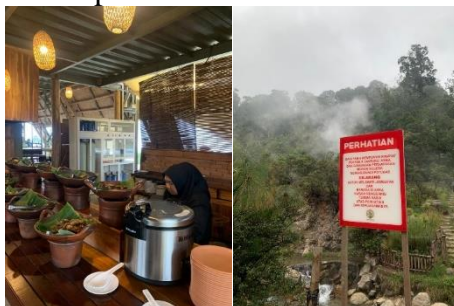
Gambar 1. Daya Tarik di Kawah Rengganis

Pengelola wisata menyatakan bahwa salah satu kendala dalam meningkatkan jumlah kunjungan adalah rendahnya kepuasan wisatawan dengan daya tarik yang disediakan oleh Kawah Rengganis, khususnya wisatawan internasional. Pertama, meski Kawah Rengganis merupakan salah satu destinasi wisata alam, namun sudah banyak fasilitas yang diperbarui sehingga tidak alami lagi seperti jalan berupa paving block . Hal ini dianggap kurang alami dan menurunkan daya tarik wisata ke Kawah Rengganis. Kawah Rengganis juga memiliki restoran berupa Kinara Resto yang menyediakan masakan tradisional. Meski demikian, banyak pengunjung masih kurang cocok dengan citarasa makanan yang disediakan. Kondisi ini berdampak pada pengunjung yang merasa tidak puas.