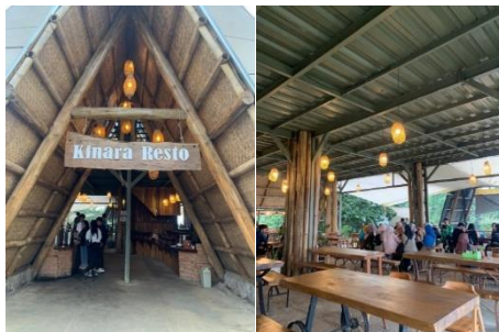
Gambar 4. Kinara Resto

disediakan mencakup berbagai makanan tradisional khas Sunda, jajanan pasar, hingga produk kopi.