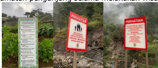
Gambar 3. Papan Petunjuk dan Informasi di Kawah Rengganis

Accessibility (aksesibilitas) merupakan sebagai kemudahan bagi wisatawan dalam hal fisik dan akses informasi, termasuk kemudahan dalam menemukan dan mencapai fasilitas, kondisi jalan yang dapat dilalui menuju objek wisata, serta adanya akhir tempat perjalanan (Silaban et al. , 2020). Pendapat lain menegaskan bahwa aksesibilitas yang baik mempermudah wisatawan untuk mengunjungi kawasan wisata yang ditawarkan (Kusyanda & Masdiantini, 2022). Dalam penelitian ini, tanggapan responden mengenai aksesibilitas termasuk dalam kategori "Baik". Hal ini ditunjukkan dengan adanya papan informasi yang tersedia di Kawah Rengganis. Papan ini khususnya bertujuan untuk meningkatkan kenyamanan dan keselamatan pengunjung selama melakukan wisata.