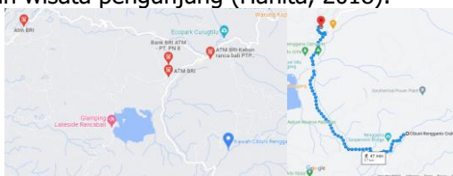
Gambar 5. Jarak ATM ke Kawah Rengganis

Ancillary (ansilari atau kelembagaan) merupakan lembaga penyelenggara perjalanan wisatawan yang meliputi pemandu wisata, agen pemesanan tiket, biro perjalanan, serta pusat informasi (Rai Utama, 2017). Ancillary juga mencakup ketersediaan sarana dan fasilitas umum yang digunakan oleh wisatawan yang meliputi bank, ATM, telekomunikasi, rumah sakit, dan lain sebagainya, yang juga berkontribusi dalam mendukung kegiatan wisata (Rahmanto et al. , 2020). Pada indikator ini, ditemukan pernyataan dengan tanggapan terendah yaitu pada pernyataan "Saya merasa terdapat mesin ATM di sekitar objek wisata". Hal ini juga didukung pada fakta di lapangan bahwa jarak tempuh ATM terdekat dari Kawah Rengganis adalah 3,7 km (Gambar 5). Kehadiran ATM dekat kawasan wisata sangat penting karena memberikan kemudahan kepada pengunjung untuk mengakses layanan keuangan dan melakukan transaksi tanpa harus meninggalkan area wisata, meningkatkan kenyamanan dan efisiensi pengalaman wisata pengunjung (Hanita, 2018).