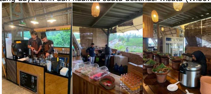
Gambar 6. Makanan yang Disediakan di Kinara Resto

Meski atraksi dan pelayanan sudah memenuhi harapan pengunjung, masih terdapat kepuasan yang kurang dari makanan yang disajikan. Makanan yang disediakan mencakup berbagai makanan tradisional khas Sunda, jajanan pasar, hingga produk kopi. Berdasarkan hasil observasi dan survey pendahuluan, makanan di Kinara Resto masih kurang disesuaikan dengan selera pengunjung yang bukan orang Sunda. Kualitas makanan memiliki dampak signifikan terhadap pengalaman wisata, karena mampu mempengaruhi citra destinasi tersebut dan kepuasan pengunjung. Makanan yang lezat dan representatif dari budaya lokal tidak hanya memuaskan selera, tetapi juga menjadi bagian integral dari penilaian keseluruhan tentang daya tarik dan kualitas suatu destinasi wisata (Wibowo, 2019).