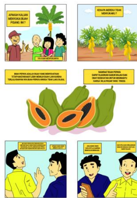
Gambar 1. cover depan komik ilustrasi buah pepaya

Pada praproduksi, Dalam perancangan komik Keluh Kesah buah Pepaya teknik yang digunakan dalam mengaplikasikan kepada media, menggunakan teknik painting, yang di desain secara digital menggunakan laptop dan software Adobe Photoshop.