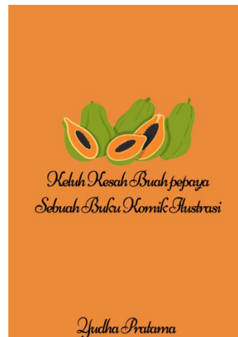
Gambar 6. cover belakang komik ilustrasi buah pepaya

Analisis pada gambar ke 4 adalah menjelaskan tentang perbincangan seorang pedagang dipasar karena harga pepaya Kembali naik dengan dijadikannya sebagai obat dan sabun wajah, dan masyarakat pun menjaga buah papaya dan merawatnya hingga tumbuh dengan subur karena harga yang Kembali normal, dan untuk pepaya dia merasa senang dan Bahagia.