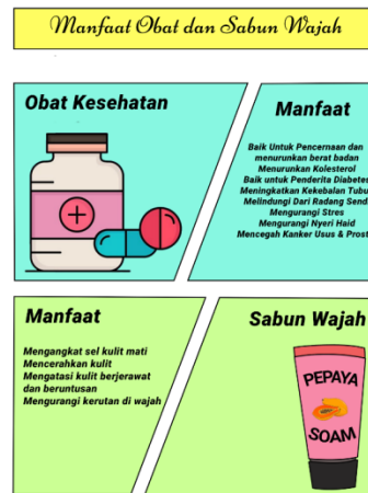
Gambar 5. isi komik ilustrasi keluh kesah buah pepaya 4

Analisis pada gambar ke 3 adalah menjelaskan tentang buah papaya dan manfaatnya jika sudah dijadikan obat ataupun sabun wajah, beberapa khasiat / manfaat obat buah papaya Baik untuk pencernaan, menurunkan berat badan, menurunkan kolesterol, baik untuk penderita diabetes, meningkatkan kekebalan tubuh, melindungi dari radang sendi, mengurangi stress, mengurangi nyeri haid, mencegah kanker usus dan prostat, sedangkan manfaat untuk sabun wajah dari buah papaya adalah mengangkat sel kulit mati, mencerahkan kulit, mengatasi kulit berjerawat, beruntusan, dan mengurangi kerutan di wajah.