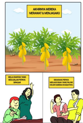
Gambar 4. isi komik ilustrasi keluh kesah buah pepaya 3

berhasil maka tingkat harga dipasaran pasti akan mengalami kenaikan, dan seorang pria ini mengolah buah pepaya menjadi obat dan sabun wajah yang sangat bermanfaat bagi masyarakat yang membutuhkannya, akhirnya pepaya pun merasa senang dan berterimakasih dengan perjuangan seorang pria yang mau mengubah buah utuh menjadi obat dan sabun wajah dengan khasiat yang sangat baik dan sehat.