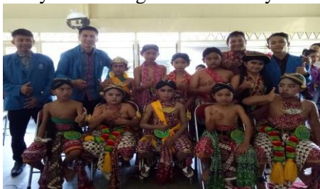
Gambar 9. Kadipaten Pakualaman Bermitra dengan UBSI