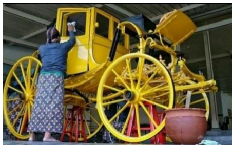
Gambar 4. Jamasan Kereta Manik Kumala Pakualaman Yogyakarta

Dari pernyataan tersebut, budaya dapat disimpulkan merupakan suatu tatanan cara hidup dan nilai luhur yang dikembangkan dalam kelompok orang pada suatu masyarakat dari generasi ke generasi. Tumbuh dan berkembangnya kearifan lokal yang mempunyai ciri khas dari setiap daerah bersumber dari nilai keagamaan atau kepercayaan, adat-istiadat dan budaya lokal masyarakat setempat yang lambat laun menyesuaikan dengan lingkungan disekitarnya. Pembangunan pariwisata berbasis budaya pada era kemajuan ilmu pengetahuan dan teknologi menjadi suatu wahana edukasi yang positif bagi generasi penerus untuk selalu mengenal untuk mencintai budaya lokal.