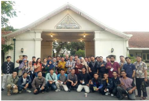
Gambar 8. Peserta Pendampingan IT Kepariwisataan