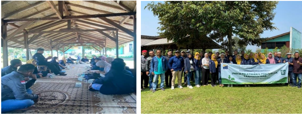
Gambar 2. Foto Pelaksanaan Kegiatan